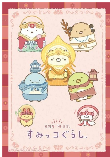
<本展コラボビジュアル>