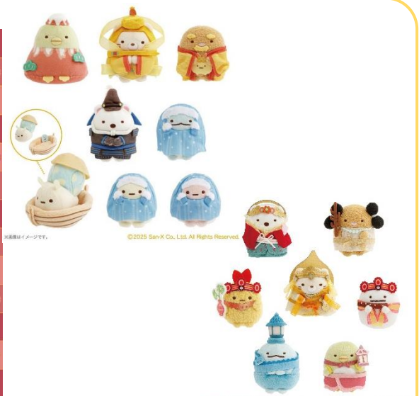
<てのりぬいぐるみ>

京都国立博物館で開催する、大阪・関西万博開催記念特別展「日本、美のるつぼ—異文化交流の軌跡—」は、大阪・関西万博の開催を記念して、古今東西の芸術文化の交流から生まれた日本美術の至宝が一堂に会します。葛飾北斎の「富嶽三十六景（ふがくさんじゅうろっけい） 神奈川冲浪裏」をはじめ、弥生・古墳時代から明治期までの絵画、彫刻、書跡、工芸品など国宝18件、重要文化財53件、海外里帰り作品を含む約200件の文化財で異文化交流の軌跡をたどります。