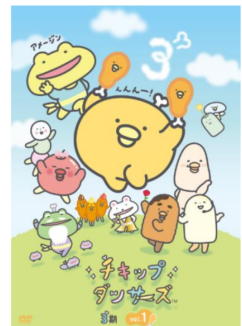
▲3期DVD vol.1 ジャケットデザイン