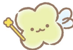
サンエックスのようせい

リラックマ、すみっこぐらし、たればんだなど、1,000を超える100%オリジナルキャラクターを生み出し続け、その不思議な魅力をオリジナルプロダクトやライセンス事業、様々なイベントやプロモーション、映像などを通じて世界中に届けています。見た目はかわいいのに、くすっと笑えるシュールさがあり、心に寄り添い包み込んでくれるような優しさを持つキャラクターたち。かわいいだけじゃないサンエックスキャラクターは多くの人々を引きつけています。