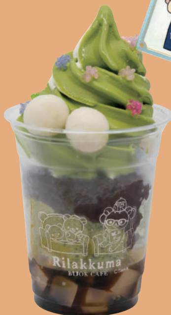
リラックマの 抹茶ミルクパフェ