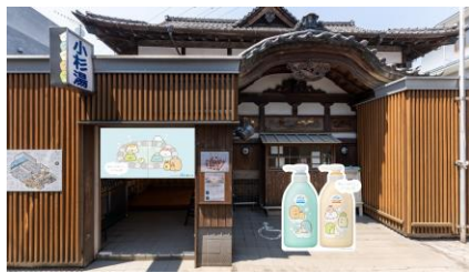
正面エントランス

小杉湯の入口には、公式コラボ暖簾や電光看板にはすみっこぐらしが登場。巨大ボトルパネルを設置し、小杉湯にやってきたすみっこぐらしたちと記念撮影をお楽しみいただけます。脱衣所やロッカー等、小杉湯の色んなところにすみっこぐらしたちが出現し、お風呂に入るまでの瞬間も暖かく彩ります。