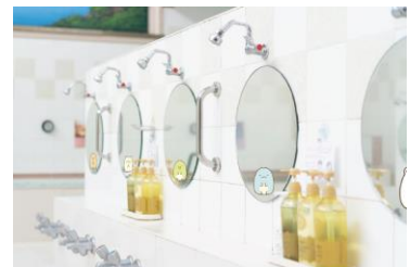
銭湯内装イメージ