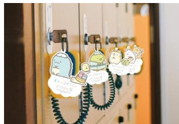
特別 Ver ロッカー（※12 日より設置予定）