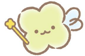
サンエックスのようせい

リラックマ、すみっコぐらし、たればんだなど、1,000を超える100%オリジナルキャラクターを生み出し続け、その不思議な魅力をオリジナルプロダクトやライセンス事業、様々なイベントやプロモーション、映像などを通じて世界中に届けています。見た目はかわいいのに、くすっと笑えるシュールさがあり、心に寄り添い包み込んでくれるような優しさを持つキャラクターたち。かわいだけじゃないサンエックスキャラクターは多くの人々を引きつけています。