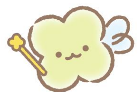
サンエックスのようせい