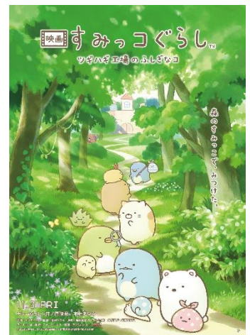
『映画 すみっコぐらし ツギハギ工場のふしぎなコ』 ティザービジュアル