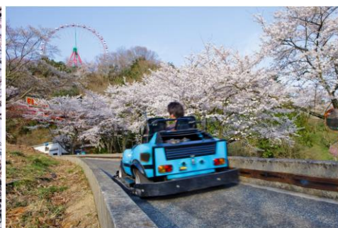
F-1 カートで“お花見ドライブ”