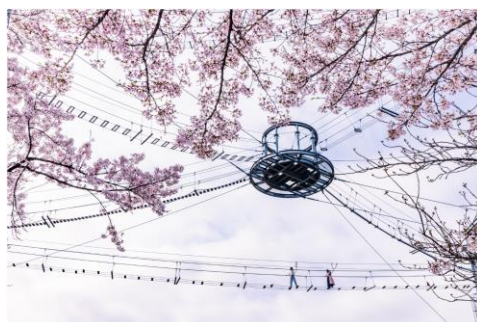
風天で体験する“絶叫お花見”