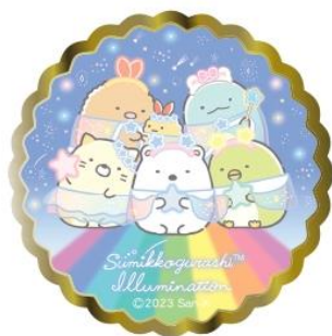
ピンバッジ 750円(税込)