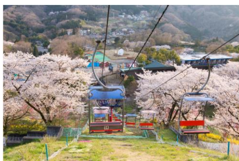
絶景のリフトで“空中お花見”

「ペアリフト」では、斜面一面に咲く桜のほか、桃、レンギョウ、山吹などの色鮮やかな景色を楽しめる“空中お花見”、標高 370m にそびえたつ絶叫吊り橋「風天」や絶叫アトラクション「極楽パイロット」では桜を見下ろしながら楽しむ“絶叫お花見”、自走式カート「F-1カート」に乗れば“お花見ドライブ”が楽しめます。アトラクションに乗ってお花見を楽しめるのは、さがみ湖リゾート プレジャーフォレストならではの。