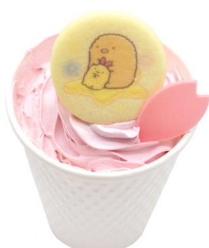
さくらストロベリーオレ 700円(税込)