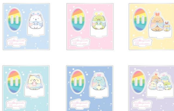
ブラインドアクリルスタンド(全6種) 各850円(税込)