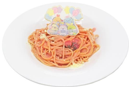
さくらカルボナーラ 1,700円(税込)

レストラン「ワイルドダイニング」では、桜をモチーフにしたピンク色のかわいらしいフードやドリンクが登場します。大きく開けた窓から大パノラマの桜景色を眺めながらお食事をお楽しみください。