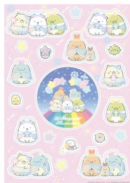
キラキラシール 650円(税込)