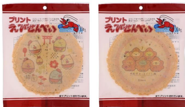
えびせんべい もみじ散策 594円(税込)