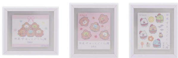
ミニフレームマグネット各種 495円(税込)