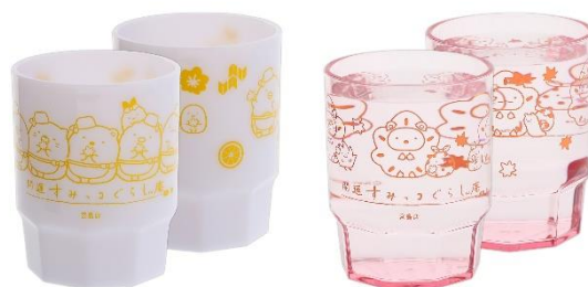
スタッキングタンブラー 770円(税込)