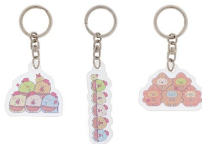
アクリルキーホルダー各種 660円(税込)