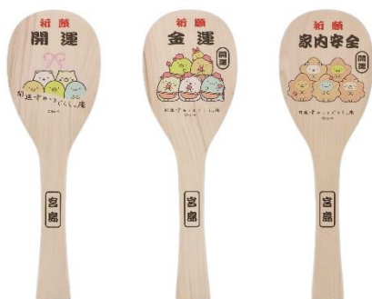
飾り杓子(大) 金運 3,520円(税込)

グッズショップでは宮島名物の「もみじ」や「しゃもじ」をモチーフにした宮島店ならではのアイテムはもちろん、「開運」「和菓子」モチーフの、すみっこぐらし庵限定商品や、すみっこぐらしグッズがたくさん用意されています♪ ※グッズは、オープン後随時発売されます。品揃えは在庫状況によって変動します。