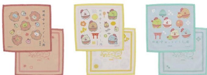
ミニタオル各種 660円(税込)