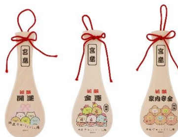
飾り杓子(小) 金運 2,310円(税込)