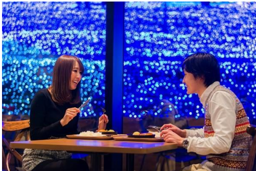
レストラン「ワイルドダイニング」

園内中心部にあるレストラン「ワイルドダイニング」では、イルミネーションの幻想的な景色を楽しみながら温かい料理をお楽しみいただけるほか、日帰り温泉施設「さがみ湖温泉うるり」も隣接しており、“イルミネーション”と“温泉”という冬の醍醐味を満喫することもできます。また、隣接するアウトドア施設「PICA さがみ湖」では、BBQ や焚火など、家族や友達と思い思いの時間をゆったりとお過ごしいただけます。