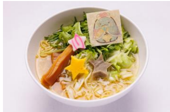
とかげのすみっ湖風 塩ラーメン 1,700 円