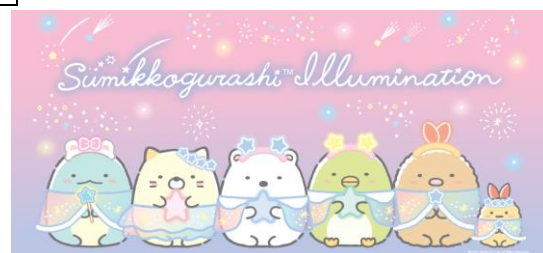
※バスタオルイメージ

遊園地に隣接する、手ぶらでキャンプを楽しめるアウトドア施設「PICA さがみ湖」では、オリジナルバスタオルと、シールラリーイベント体験がついた特別キャンププランが登場します。お昼は遊園地でたっぷり遊び、夜はすみっこぐらしイルミネーションを楽しんだあとはそのままゆったりとお泊りいただけるプランです。※詳細は決定次第 WEB サイトでお知らせいたします。