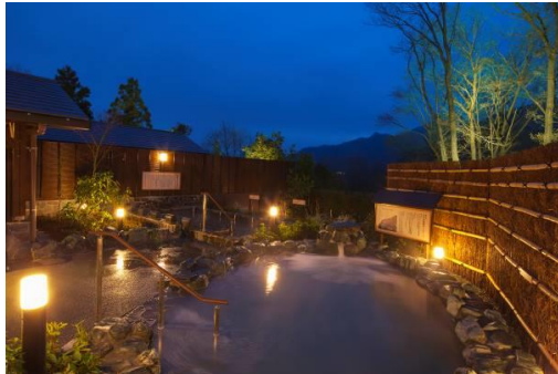
さがみ湖温泉うるり