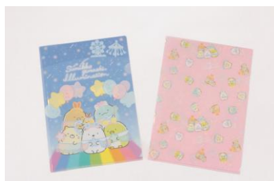
A4 クリアファイル (2 枚 1 セット) 700 円