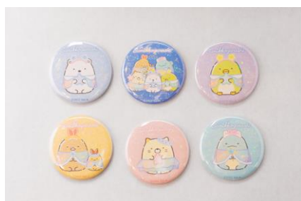
ブラインド缶バッジ (全 6 種) 500 円