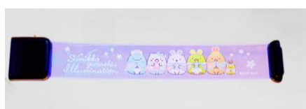
光るブレスレット 900 円