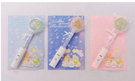
光るキャンディ (全 3 種) 680 円