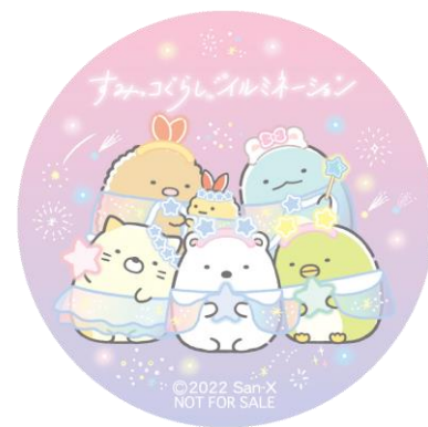
※缶バッジイメージ