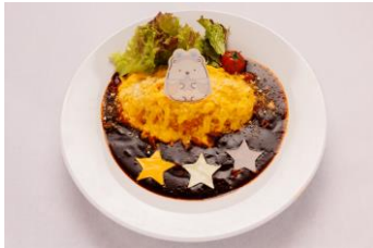
みんな大好き！しろくまの デミオムライス 1,800 円