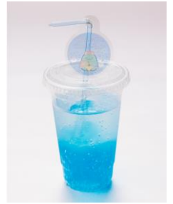
しゅわしゅわすみっコド リンク (全 5 種) 700 円 ※ストローチャーム付き