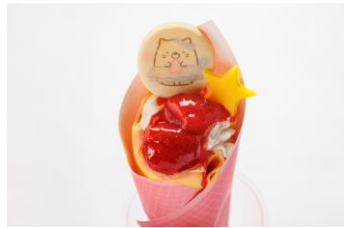
ねこのいちごクレープ 900 円