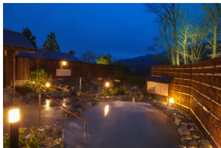
さがみ湖温泉うり

遊園地に隣接する日帰り温浴施設「さがみ湖温泉うり」では、露天風呂やサウナ、岩盤浴をお楽しみいただけるほか、アウトドア施設「PICA さがみ湖」では、BBQ や焚火など、家族や友達と思い思いの時間をゆったりとお過ごしいただけます。